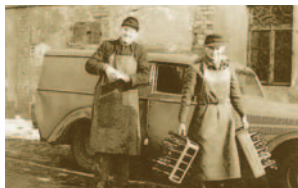
Februar 1953: Das erste Firmenfahrzeug