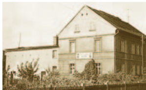
1956: E.-Thälmann-Str. 18 in Ruhland Hinterhaus Abfüll- und Lagergebäude