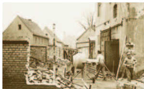
1969/1970: Auf- und Ausbau des Brauereigebäudes in der Bahnhofstraße