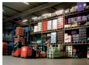
Heute: Moderne Lagerung der 5000 Artikel in Regalen