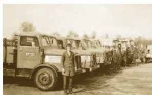
Mai 1972: Fuhrpark, kurz nach der Enteignung