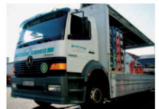
Heute: Wir beliefern Südbrandenburg bis Sachsen