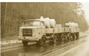
1971: Tankbier nach Ruhland