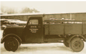
14. Mai 1954 „Phänomen“: Der erste neue Lkw, 2t Ladegewicht