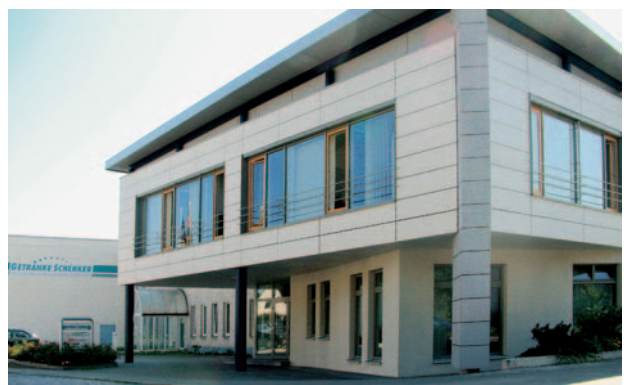
Heute: Unser neues Firmengebäude in Senftenberg