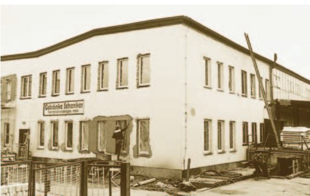
1991: Das Firmengelände in Senftenberg während des Umbaus