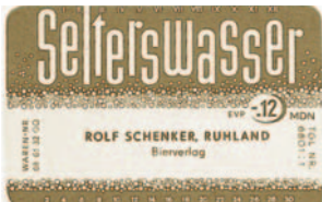
1956: Eigenproduktion von alkoholfreien Getränken