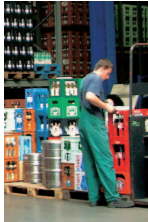
Heute: Ein Lagerarbeiter beim Kontrollieren der Ware