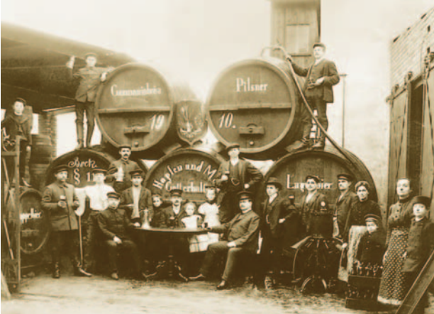
1910: Germania Brauerei Ruhland, der Vorläufer des Bierverlages Rolf Schenker am Standort Ruhland

1957 Die Konsumgeschäfte dürfen keine Getränke von Schenker mehr abnehmen.