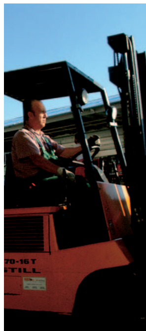
Heute: Einsatz moderner Gabelstapler auf dem Hof